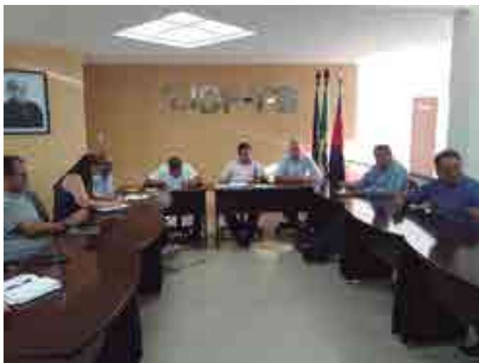
A reunião do conselho técnico foi comandado pelo presidente da FPF