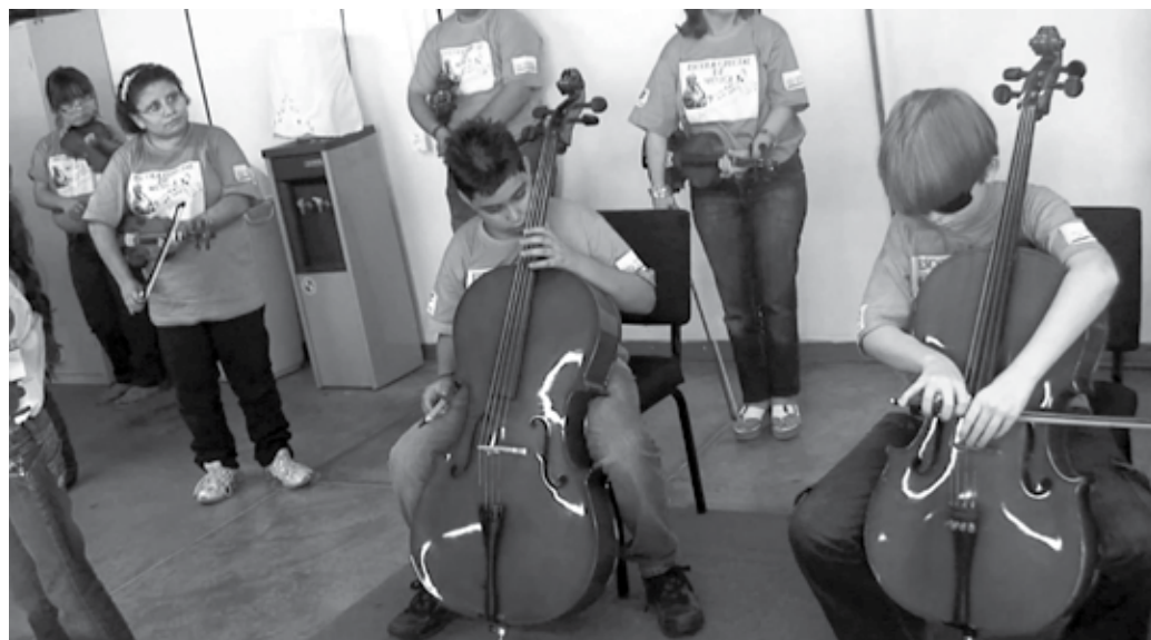
A Escola de Música Juarez Johnson é pioneira na socialização pela arte de pessoas com necessidades especiais

A EEMJ é referência no desenvolvimento de atividades artístico-culturais e atendimento às pessoas com necessidades especiais pela abordagem individual que adota. O público-alvo são crianças com idade a partir de um ano e jovens