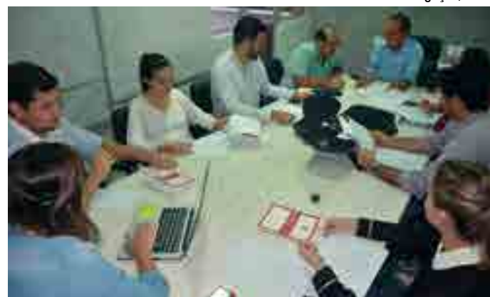
Comissão estabelece prazo para vereadores apresentarem sugestões

Entre as mudanças realizadas, destacam-se as que abrangem as pessoas com deficiência, o disciplinamento do dia a dia das sessões ordinárias, da ordem do dia, quais as prioridades a serem votadas pela Casa, ou seja, quais matérias devem ter primazia em relação a outras e a diminuição do número de honorarias concedidas pela Câmara, entre outras. “Também permitimos, através de instrumentos, como a Ouvidoria, Corregedoria e Conselho de Ética, uma maior fiscalização dos assuntos do Legislativo, aproximando