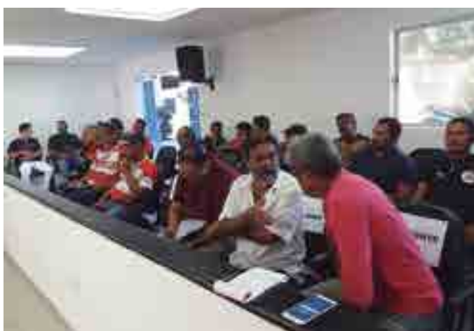
Vários representantes de clubes participaram das discussões na entidade