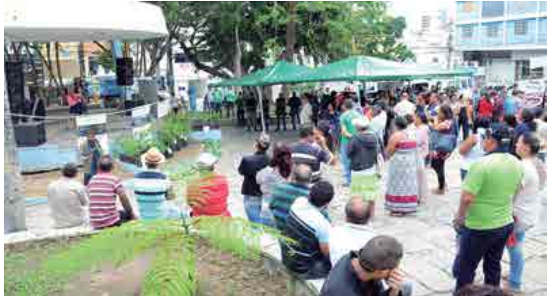
Apresentações artísticas atraíram a atenção do público presente à Feira Agroecológica na Praça Clementino Procópio